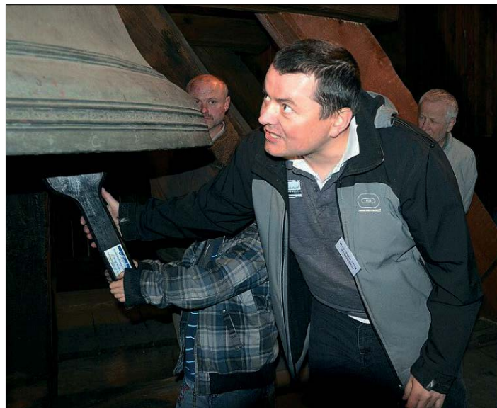
◀ Při průvodcovské službě v rámci Noci kostelů v Náchodě

naskicoval. Samozřejmě bylo potřeba ten návrh rozpracovat, domyslet, ale ten základ jsem „dostal“ – jinak se tomu nedá říct – ve snu. Nedá mi to, abych nezmínil i úplný začátek tohoto mého „koníčku“. Přihlásil jsem se na fakultě do volitelného předmětu sakrální architektura a jako ročníkovou práci jsem si chtěl zapsat návrh kaple. Zmínil jsem se o tom svému učiteli architektury průmyslových staveb a on mě začal od toho odrazovat. Říkal: „Kolik myslíš, že takových kaplí a kostelů se postaví za tvůj život? Dvacet? Třicet? Taková věc se ti, hochu, když budeš mít veliké štěstí, poštěstí jednou za život.“ No, a protože Bůh má smysl pro humor, tak se mi to poštěstilo už desetkrát, z toho vloni dvakrát a tento rok jsme jednu kapli již také slavnostně otevírali. Vždy znovu při novém zadání úpravy presbytáře, stavbě sborového domu nebo nové kaple si vzpomenu na tu dobře míněnou radu a pousměju se Božímu humoru a velkorysosti.