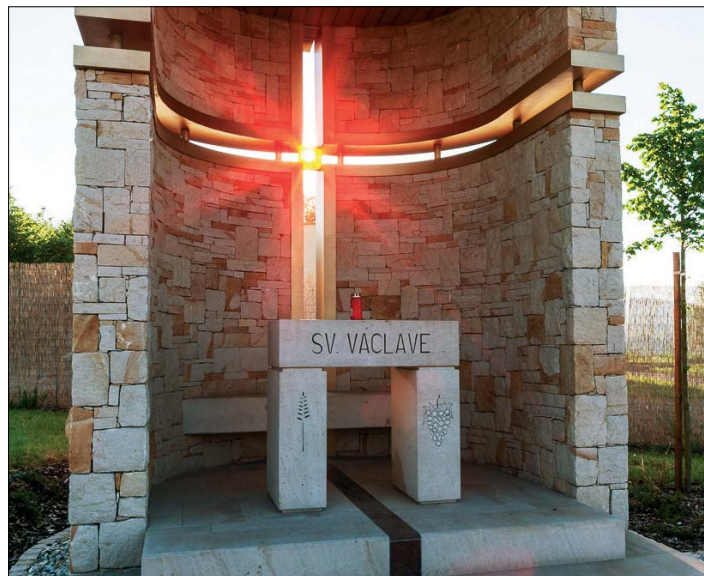
☛ Kaple sv. Václava ve Voletínách u Trutnova

skladatel. Je ve své kreativě omezován funkcí stavby, finančními možnostmi zadavatele, statikou a také představou – zadáním zadavatele. Po pravdě jsem asi neměl zakázku, kde bych pracoval zcela volně bez zadání. Naopak jsou zákazníci, kteří svým zadáním návrh předurčí a zadají tolik parametrů, že jen obtížně hledáte nějakou přijatelnou architektonickou formu. Zjednodušeně řečeno, když si u designera objednáte objemné dodávkové auto, nemůžete zároveň chtít, aby vypadalo jako formule 1. Ideální je přiměřeně vymezující zadání, ke kterému dojdeme diskusí s klientem. Chci si být jistý nejen tím, co chce, ale také proč to chce. Jaká je jeho motivace, abych mohl hledat třeba i nevhodnější řešení prostorového puzzle. Třeba při spoluutváření zadání k rodinným domům se podrobně ptáme klientů na životní styl, jejich koníčky, domácí mazlíčky. Ale také třeba na alergie kvůli volbě podlahovin, možnosti krbových kamen nebo druho- vé skladbě výsadby v zahradě. Věřím, že potom se v takovém domě cítí opravdu doma.