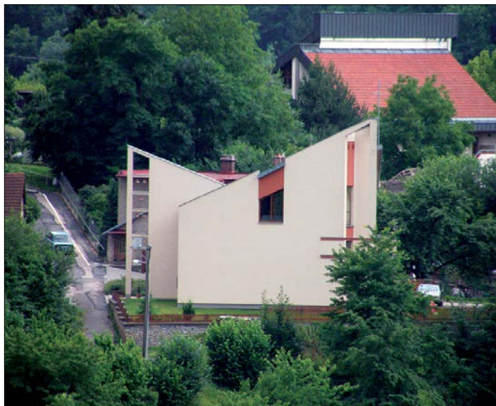
◀ Sborový dům Církve bratrské v Novém Městě nad Metují