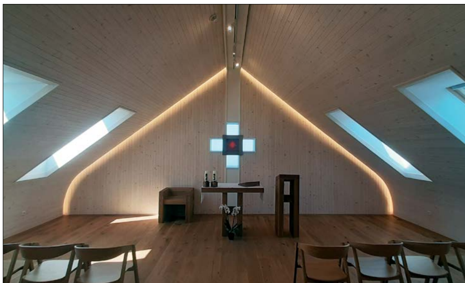
Podkrovní kaple sv. Josefa na Hoře Matky Boží u Králík