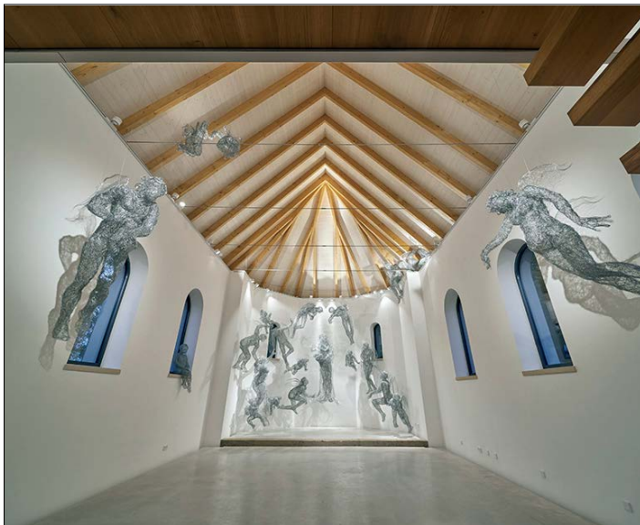
☛ Kaple sv. Josefa ve Slavětíně