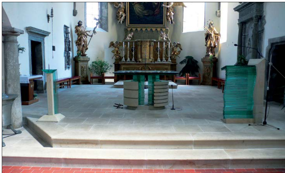
( Presbytář kostela sv. Vavřince v Náchodě

Osvědčené způsoby, jak přistupovat k četbě Božího slova, jak se s ním modlit a nechat ho promlouvat do svého života. Oblíbená pomůcka pro všechny, kteří se chtějí pustit do dobrodružství četby Pisma a hledají praktického průvodce s konkrétními tipy. Brož., 108 stran, 149 Kč